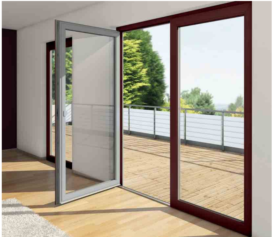
Kreative Möglichkeiten bei der außen- und innenseitigen Gestaltung mit Schüco AutomotiveFinish.