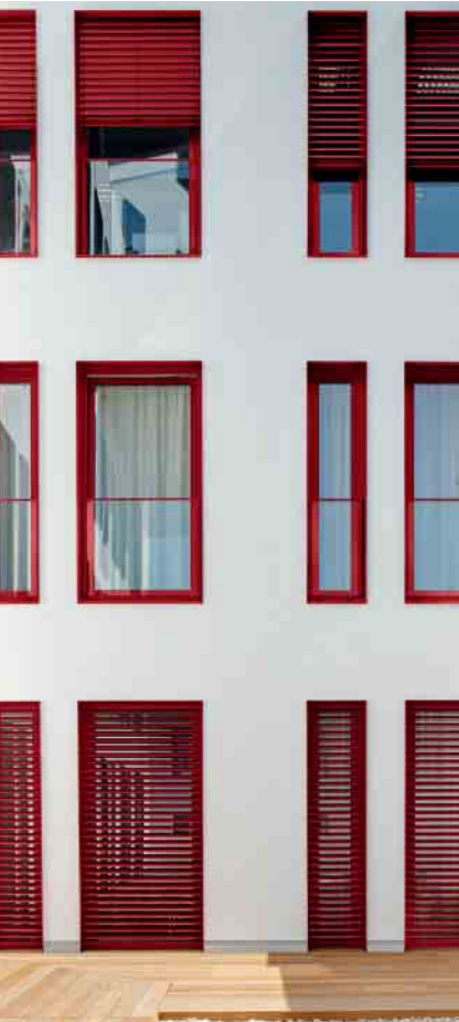
Mit Schüco AutomotiveFinish lassen sich neue gestalterische Impulse mit preislich attraktiver Leistung verbinden.