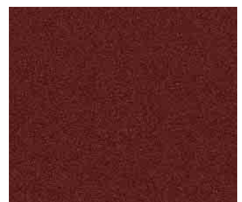
SAF-RAL 350-M* *semigloss