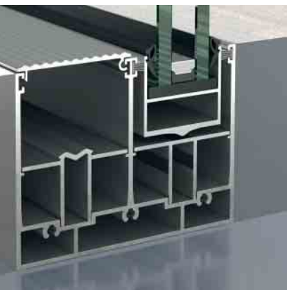
Schüco Schiebesystem ASS 39 PD.NI Schüco Sliding System ASS 39 PD.NI

Ungedämmtes Aluminium Schiebesystem Non-insulated Aluminium Sliding System